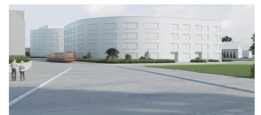
Visualisering ny gatuvy Stensbergsvägen från Södra vägen