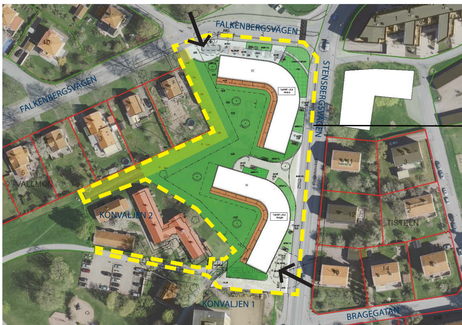
Principskiss kring möjlig bebyggelse, utformad som två bågformade volymer (vit färg) inom planområdet (gul streckad linje). In- och utfart tillåts i nordväst och sydost (svarta pilar). I väster ska finnas parkstråk mot angränsande fastigheter (ljusgrön färg).