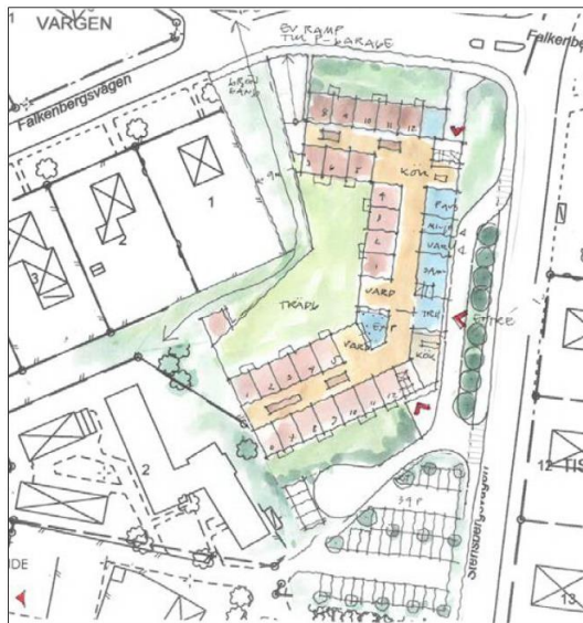
Figur 3, Väster om Stensbergsvägen