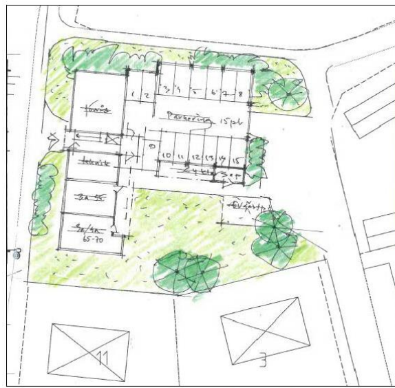
Figur 4, Öster om Stensbergsvägen