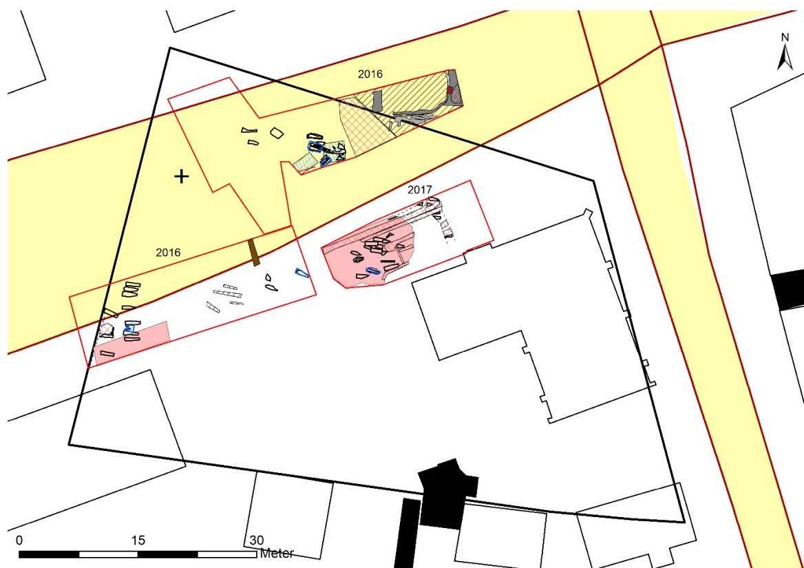
Fig 3. Den svarta linjen visar den tänkta utbredningen av kyrkogården med den kunskap som finns efter undersökningarna fram till 2017. Hyreshuset Domherren 21 i nedre vänstra hörnet.

Utbredningen av kyrkogården kom att bli lite större än den som Sylvander föreslagit efter det att de arkeologiska undersökningarna som gjorts från 1987 till 2017 sammanställdes, nedan i fig 3 är den utbredningen markerad efter de kunskaper vi har idag.