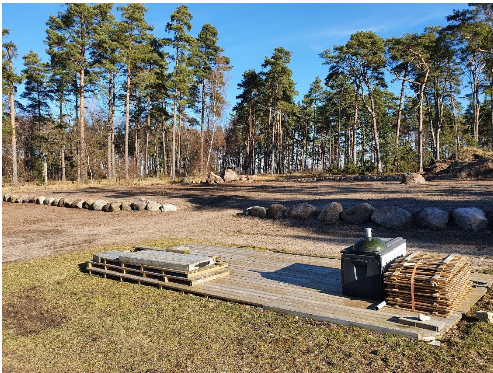
Område 2 sett från befintligt campingområde.