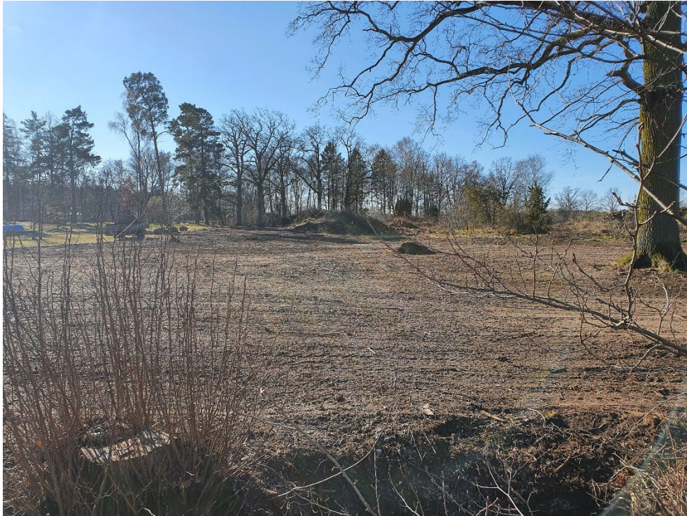
Område 3 från norr. Vattendraget i förgrunden, befintligt campingområde till vänster i bakgrunden.