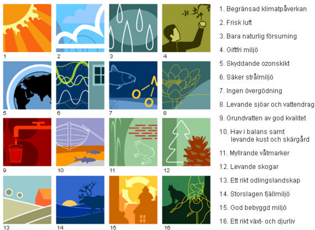
Figur 1. Sveriges 16 miljö kvalitetsmål.