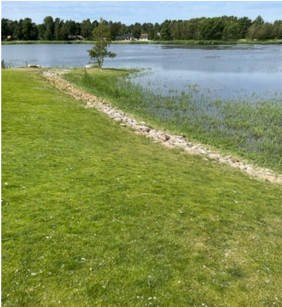
Strandskoningen sedd från Bo 1:176.