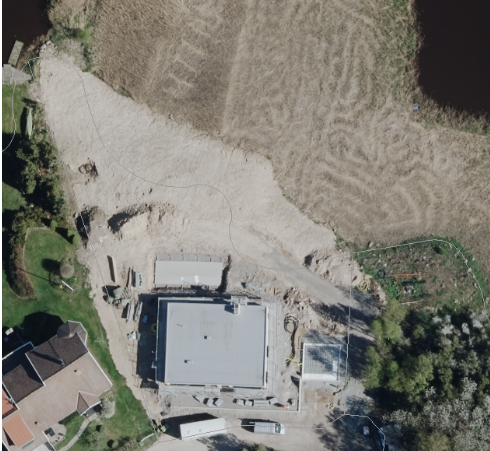
Flygfoto från 2018, innan strandskoningen var färdig.