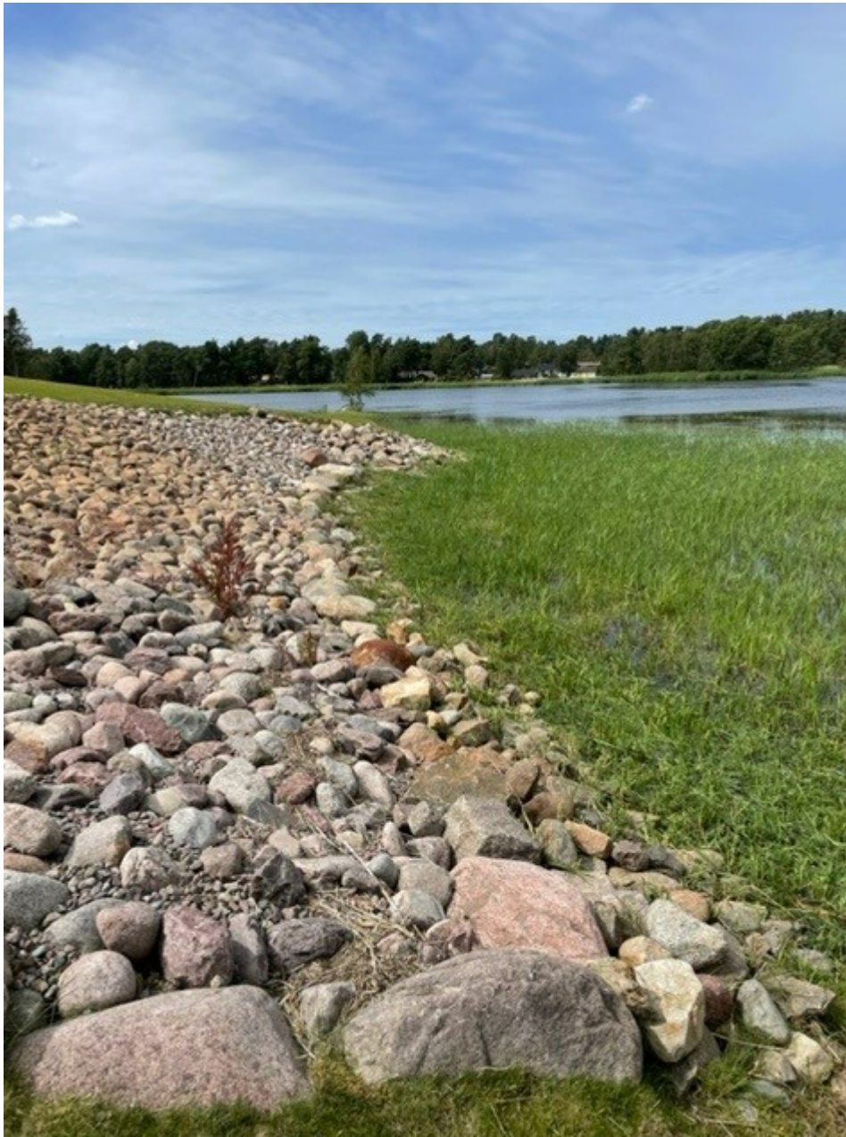
Foto som visar strandkoningens utseende.