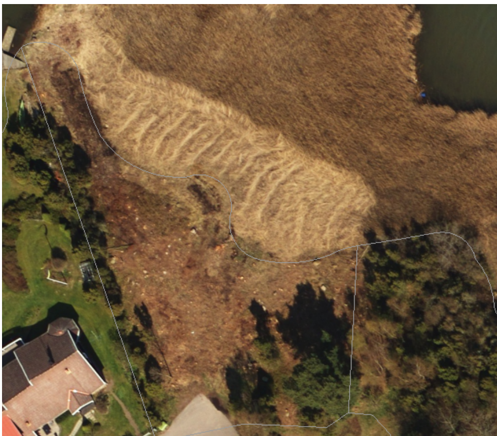
Flygfoto från 2016, innan Bo 1:176 bebyggdes.