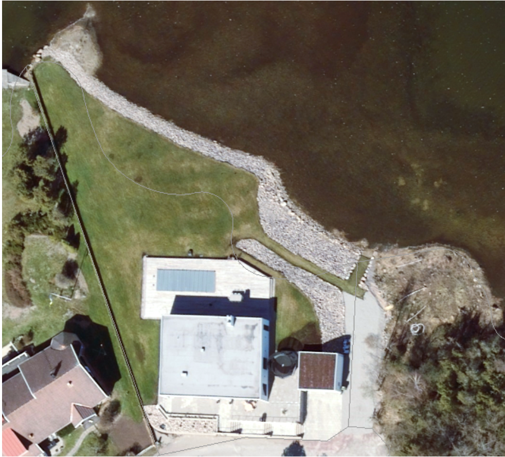
Flygfoto från 2020 där strandskoningen syns.