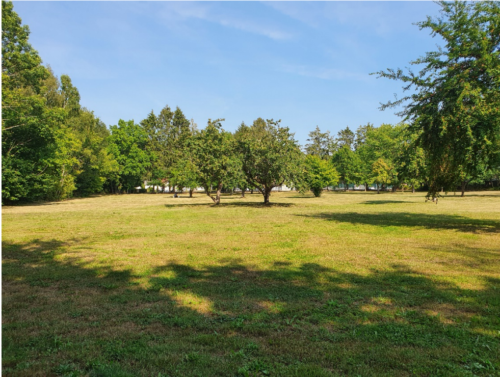
Aktuellt område sett från ån.