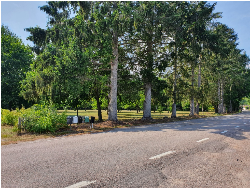
Aktuellt område sett från Kolbodagatan