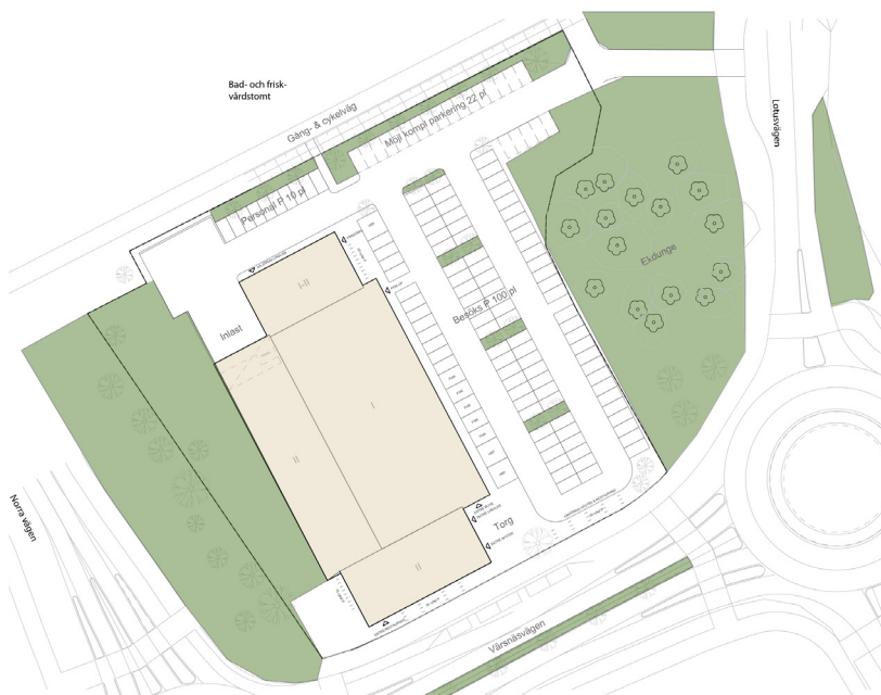
Schematisk situationsplan för framtida centrumkvarteret, grönska och vägnätet.

Utvecklingen inom planområdet är i linje med Kalmar kommuns översiktsplan och planprogrammet för Snurrom. Genomförandet av planförslaget antas inte medföra en betydande miljöpåverkan.