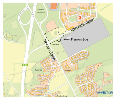
Bilden visar planområdets läge