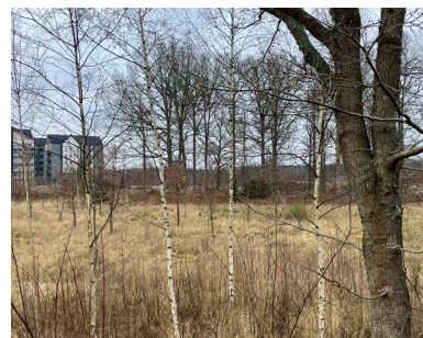
Bild från planområdet.