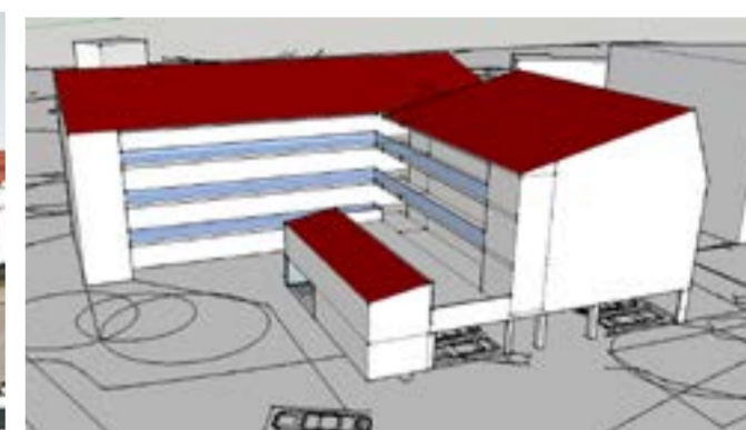
Volymstudie sett från Indungatan.