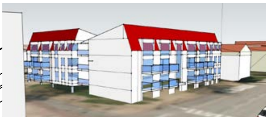
Volymstudie sett från Stensbergsvägen.