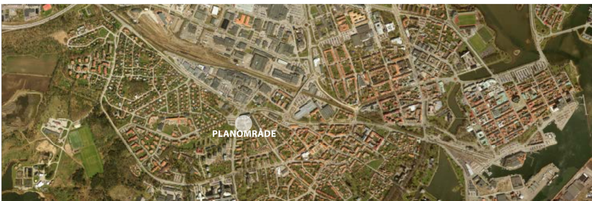
Kartan visar områdets geografiska läge i Kalmar.

Kalmar kommun Samhällsbyggnadskontoret Planeringsenheten, Box 611 391 26 KALMAR