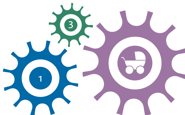
Delmål 4 har tydliga kopplingar till delmål 1 och 3.

Kvinnor och män ska ta samma ansvar för hemarbetet och ha möjligheter att ge och få omsorg på lika villkor.