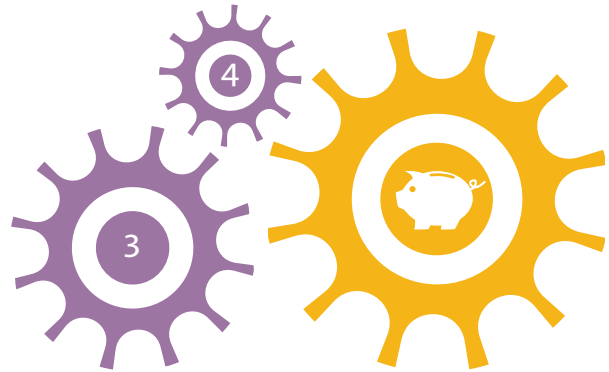
Delmål 2 har tydliga kopplingar till delmål 3 och 4.

Kvinnor och män ska ha samma möjligheter och villkor i fråga om betalt arbete som ger ekonomisk självständighet livet ut.