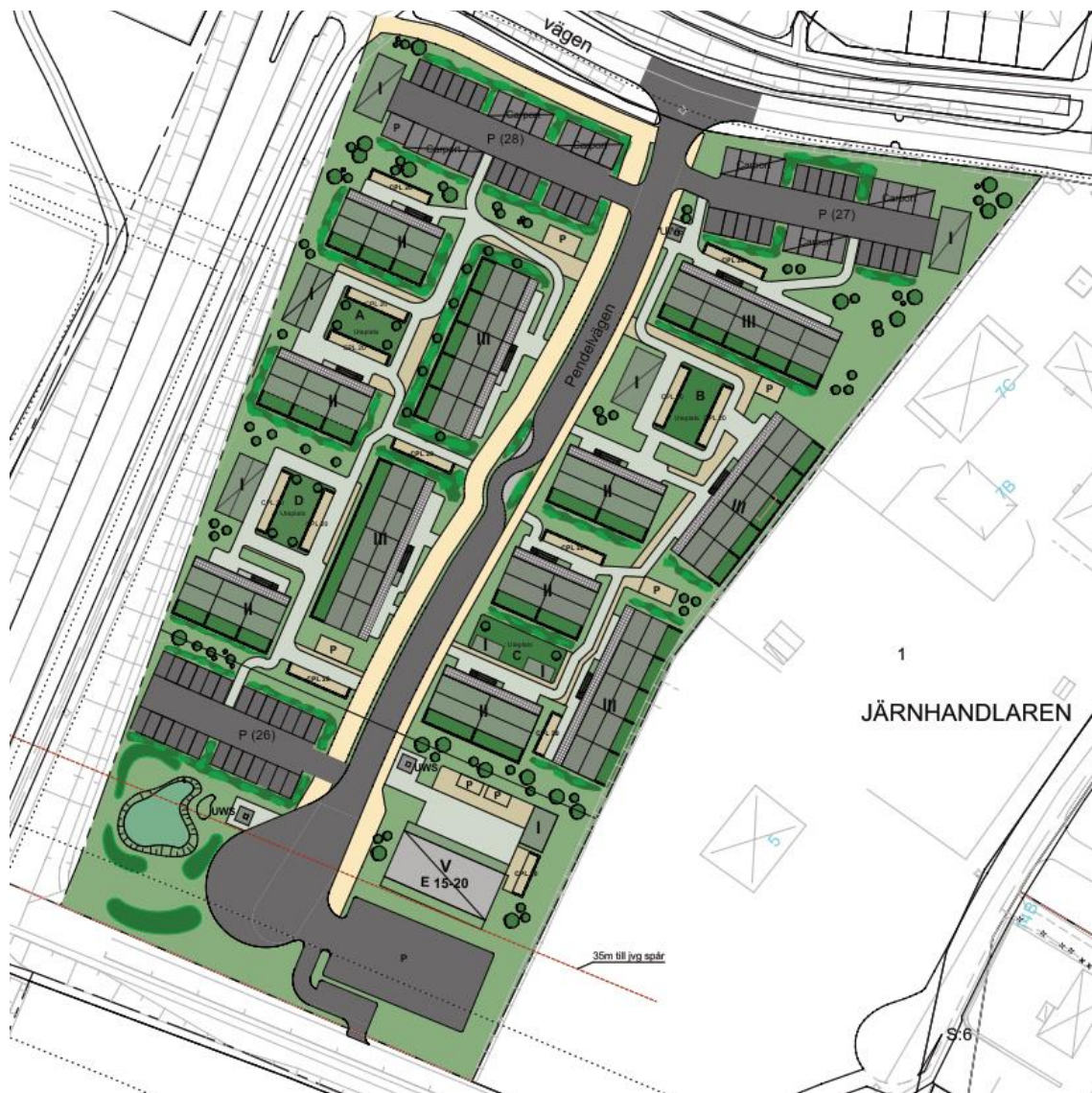
Figur 1: Områdets dispositionsskiss (daterad 2018-12-02)

I dagsläget är området endast exploaterat med en gata (Pendelvägen), vändplan samt en mindre parkering i anslutning till Smedby tågstation. I övrigt är marken oexploaterad och gräsbevuxen.