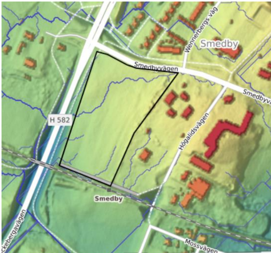
Figur 2: Topografien inom området. Planområdet är markerat med svart linje. Blå färg visar lägre nivåer och gul färg högre nivåer. Flödesvägar visas med blå linjer.

Terrängen är relativt flack med nivåer mellan ca +10 m till +14 m. Marken lutar åt sydväst, vilket flödesvägarna i Figur 2 visar. Flödesvägarna visar även att planområdet inte belastas av ytvatten från intilliggande områden. Ytvatten som uppstår norr om planområdet rör sig västerut och därefter söderut. Utanför planområdets västra gräns finns en skarp slänt ner mot Kläckebergavägen och viadukten under järnvägen.