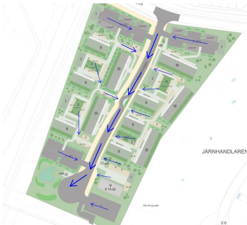
Figur 5: Ytliga flödesvägar vid större regn markerade på områdets dispositionsskiss (daterad 2018-12-02).

För att få ett tillräckligt skydd för byggnader rekommenderas att mark vid hus är minst 30 cm högre än intilliggande hårdgjord yta eller parkering. Detta kan regleras med hjälp av planbestämmelser.