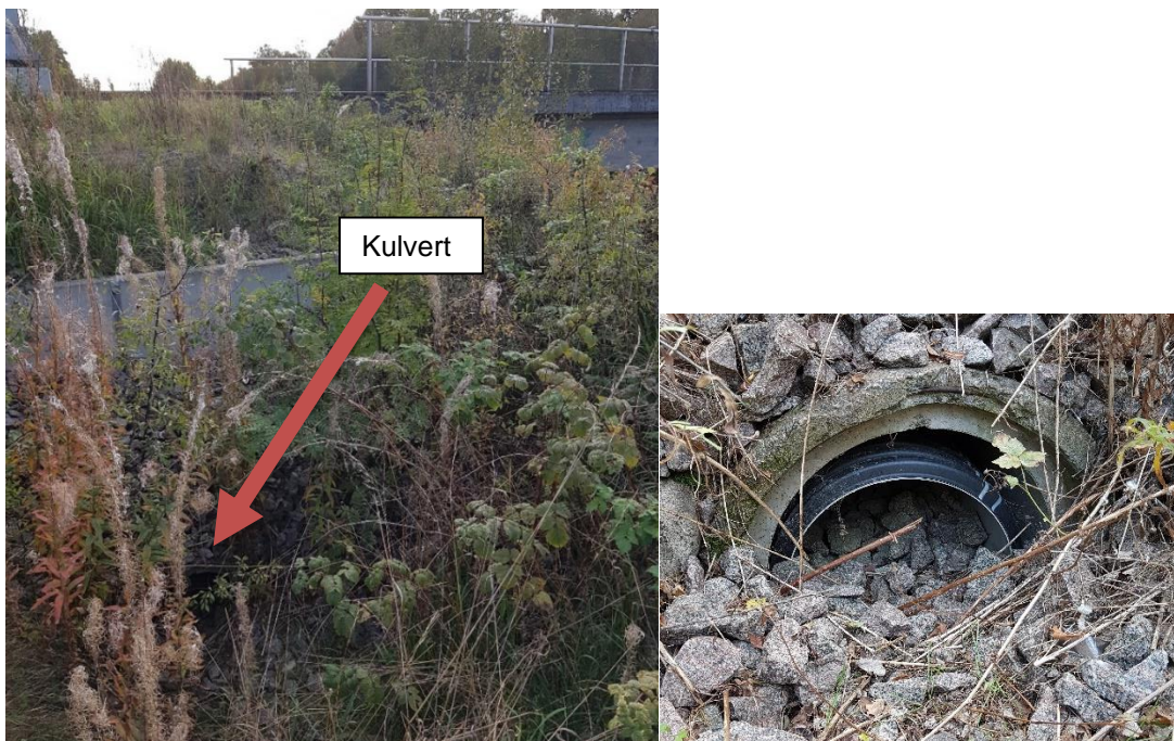
Figur 4: Kulverten och dess läge i förhållande till kringliggande mark.