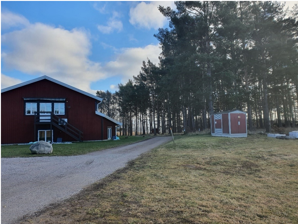
Befintlig hotellbyggnad. Den nya byggnaden placeras i tallskogen till höger.