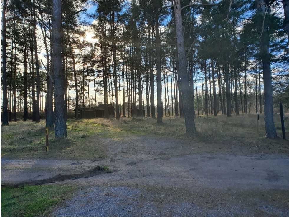
Plats för ny hotellbyggnad, sett från befintlig hotellbyggnad.