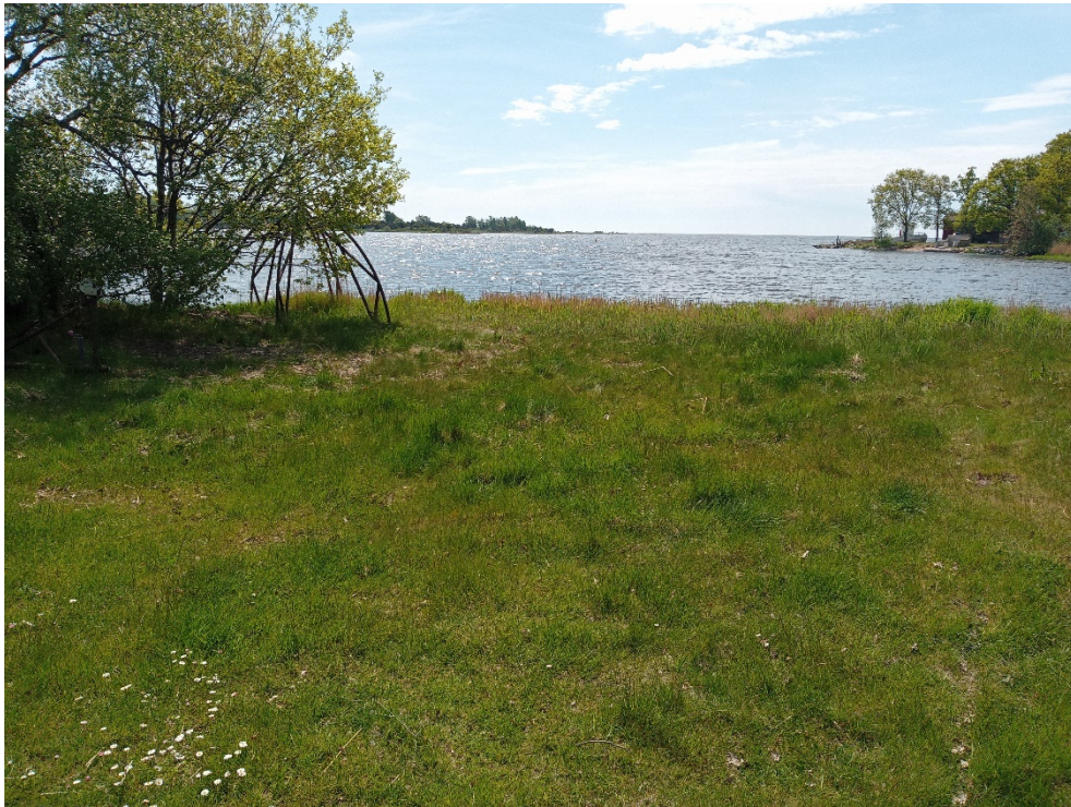
Platsen där bastun ska placeras