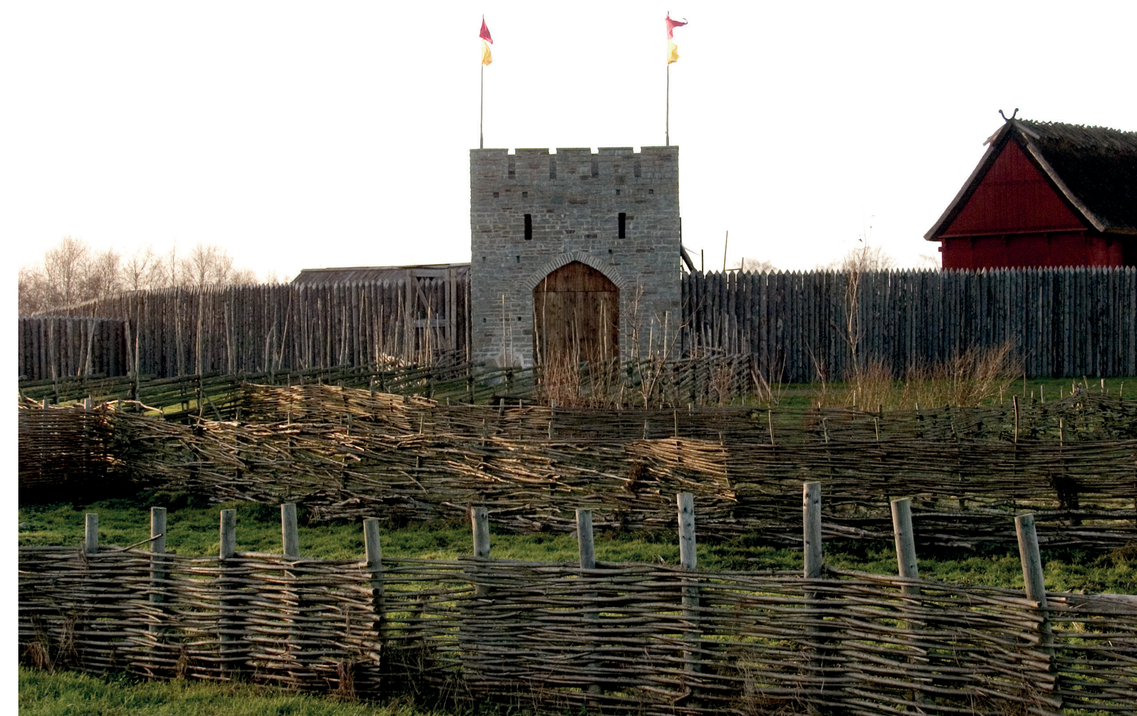
Salvestaden år 1997.

Tvärs genom området skär en uppbyggd banvall, som tydligt visar var järnvägen mellan Kalmar och Torsås gick. Bygget av banan började i december 1897. Redan efter 1 ½ år var man klar, och banan öppnades för trafik den 8 augusti 1899. Från Kalmar byggdes det med samma spårvidd som Kalmar-Berga Järnväg. Söder om Torsås valde man en annan spårvidd. Detta innebar att alla tågsvagnar med varor måste lastas av och lastas om till andra vagnar i Torsås. Statens Järnvägar (SJ) tog över driften 1940, men lade ner den på 1960-talet. Förutom banvallen finns en ursprunglig järnvägsbro över Törnebybäcken. En annan järnvägsbro uppe vid gården togs bort och byggdes om till en backe, som idag är en del av cykelvägen.