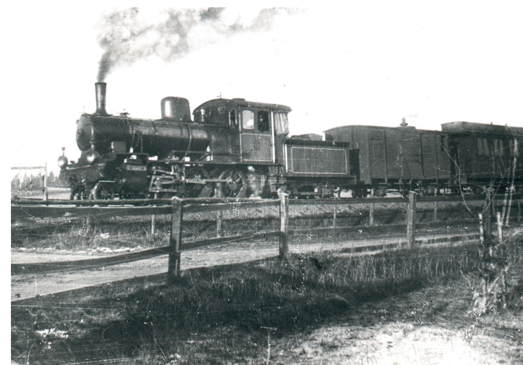
När den nya järnvägen mellan Kalmar och Torsås stod klar 1899 var det ånglok som drog vagnarna. Det är spännande att föreställa sig hur det lät och såg ut då dessa då moderna maskiner för fram genom det gamla landskapet.