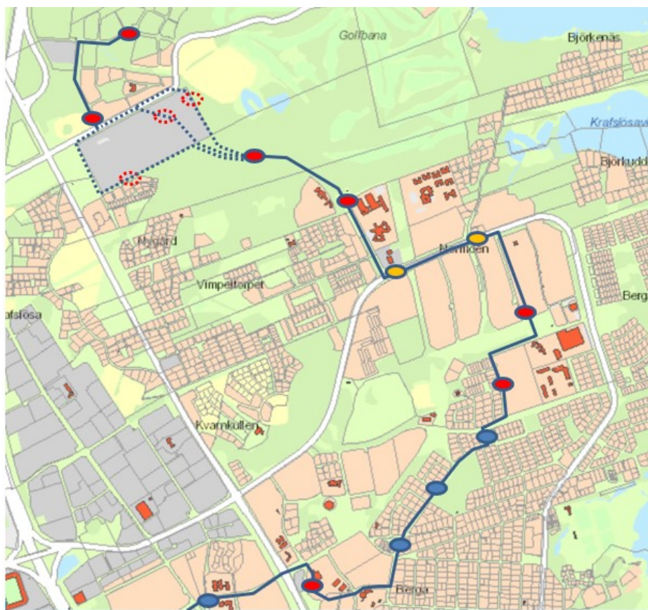
Figur 1, Norra Länken, Berga Centrum – Norrliden - Snurrom

Målsättningen är att färdigställa Norra länken i tid för invigningen av den nya bad- och friskvårdsanläggningen. Ett effektivt genomförande möjliggörs och villkoras av medfinansiering via stadsmiljöavtal.