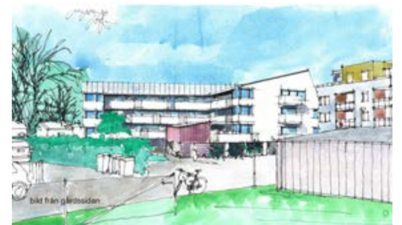
Illustration framtida bebyggelse, vy från lekplatsen öster om Idungatan.