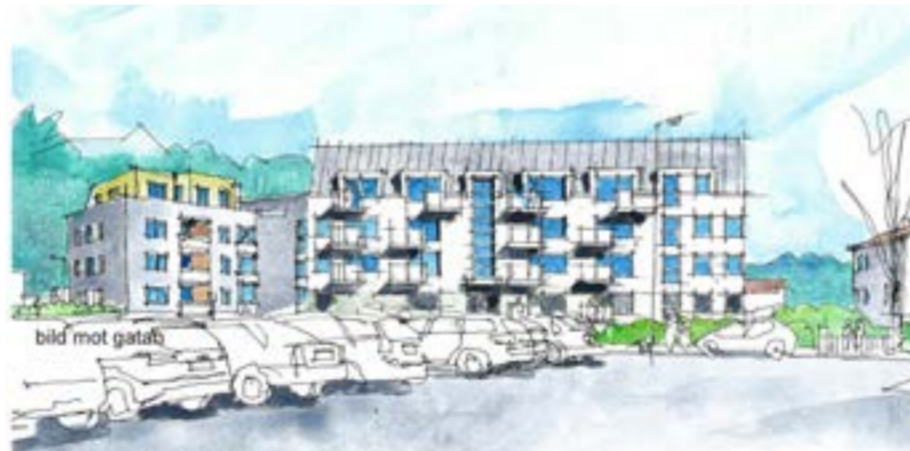
Illustration, framtida bebyggelse, vy från parkeringen väster om Stensbergsvägen.