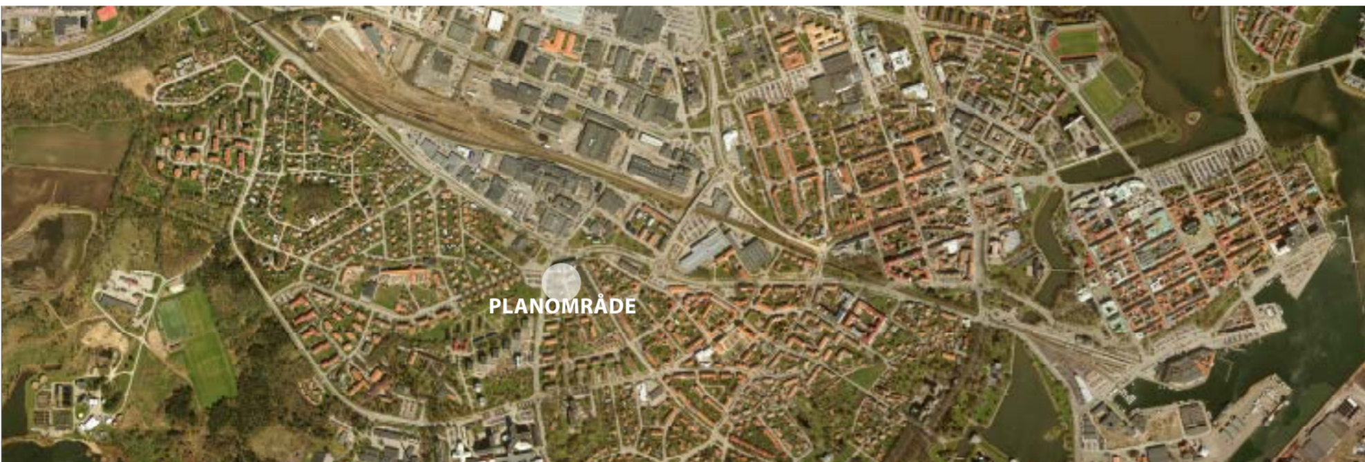
Kartan visar områdets geografiska läge i Kalmar.