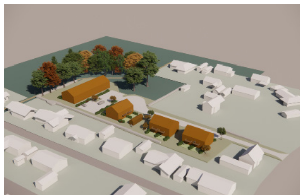
Illustrationen visar blandade bostadstyper. (ATRIO arkitekter)