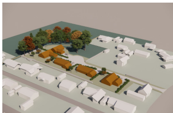
Illustrationen visar fem villor. (ATRIO arkitekter)