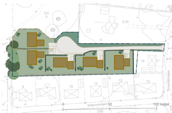
Förslaget visar fem villor. (ATRIO arkitekter)

Detaljplanen möjliggör för olika bostadstyper så som villor, par-, rad- och kedjehus samt ett mindre flerbostadshus i samma storlek som ett radhus. De två förslagen nedan visar exempel på hur området kan utvecklas. Det ena förslaget visar fem villor och det andra förslaget visar en mix av andra småskaliga bostadstyper.