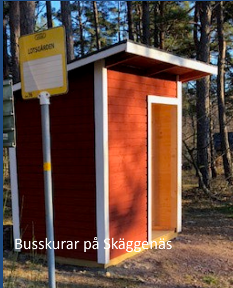
Buskurar på Skäggenäs