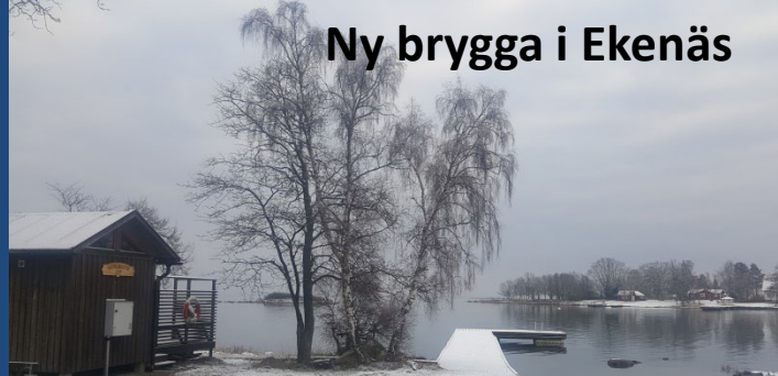
Ny brygga i Ekenäs