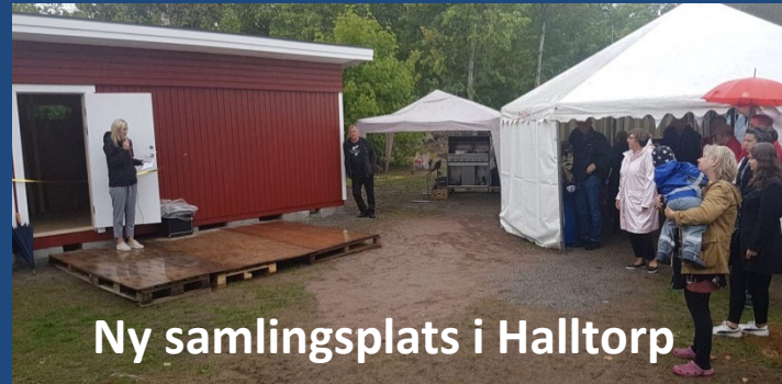
Ny samlingsplats i Halltorp