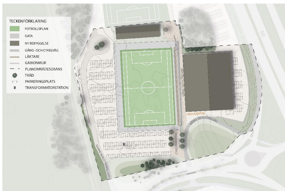
Figur 4: Möjlig parkeringsutformning vid konstgräsplan samt planerad inomhushall

Nedan redogörs alternativ utformning för bilparkeringsplatserna invid konstgräsplanen (se Figur 4 ). Förslaget möjliggör cirka 285 bilparkeringsplatser, vilket är tillräckligt många för att tillsammans med de befintliga och de redan planlagda i norr, uppnå 800 – 1 000 platser totalt för hela området. Antalet bussparkeringsplatser kan utökas vid behov.