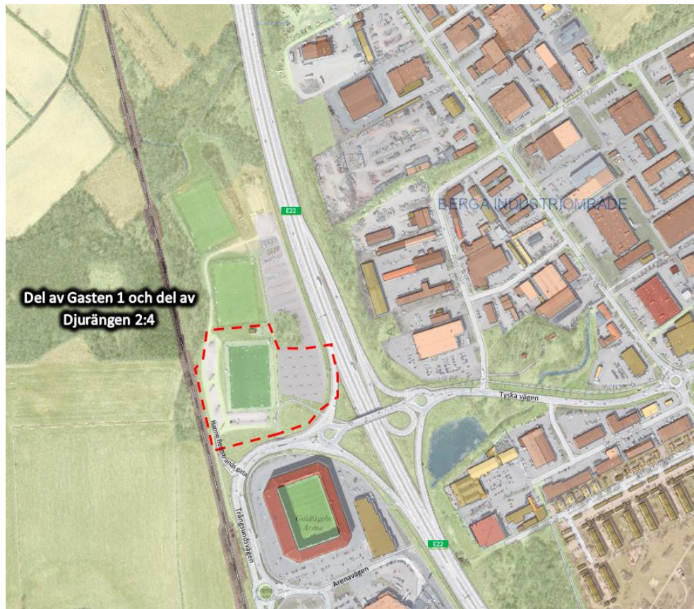
Figur 1: Planområde del av Gasten 1 och del av Djurängen 2:4, Hansa City

En detaljplan för Del av Gasten 1 och del av Djurängen 2:4, Hansa City (se Figur 1 ) avses att genomföras med syftet att möjliggöra för en ny inomhushall för idrottsverksamhet.