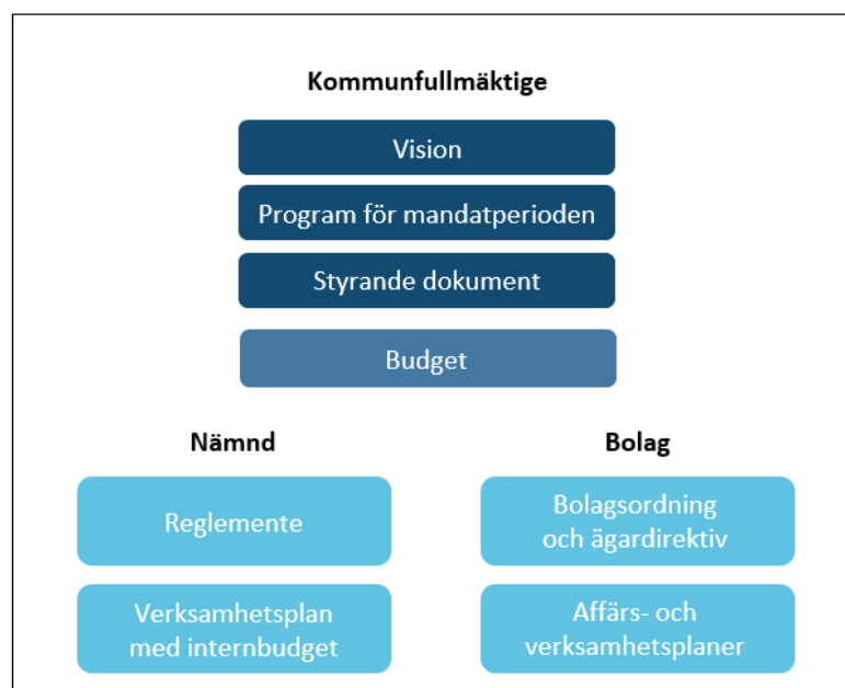
Styrmodell Kalmar kommun

Dessa fyra dokument skrivs fram under hösten 2024.