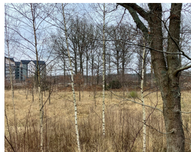
Bild från planområdet.