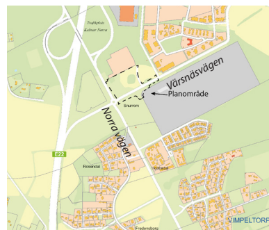
Bilden visar planområdets läge