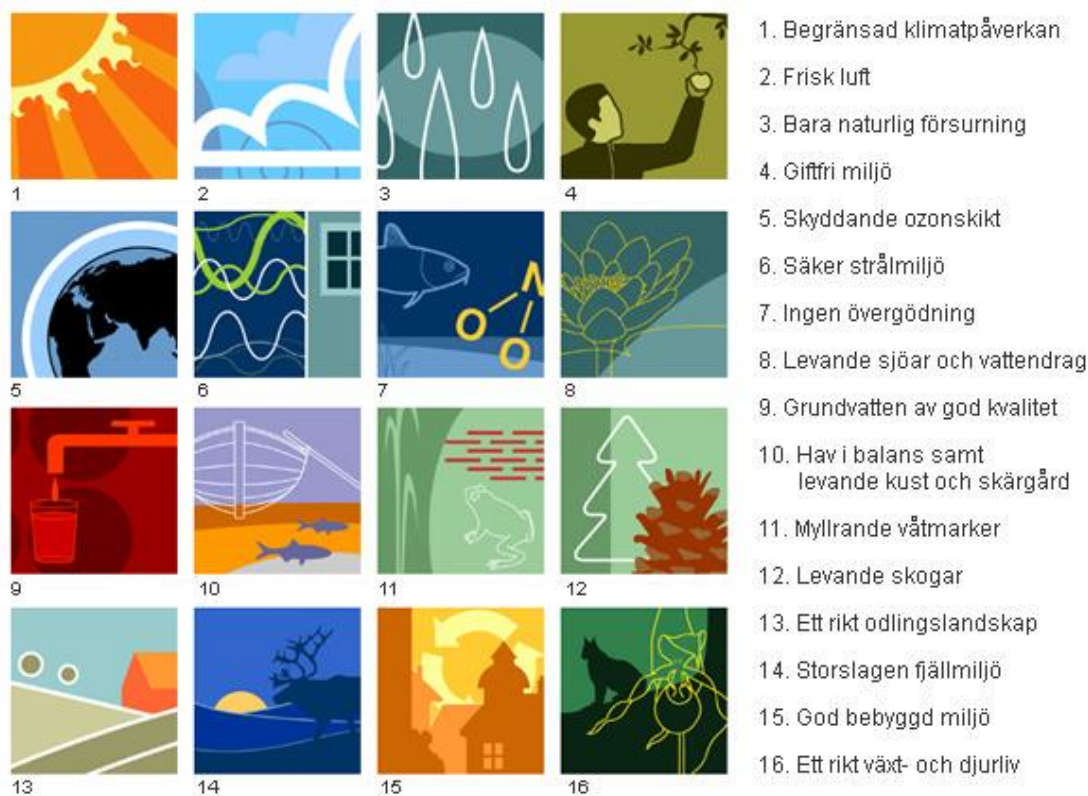
Figur 1. Sveriges 16 miljökvalitetsmål.

Vi i Sverige ska lösa våra miljöproblem nu och inte lämna över dem till kommande generationer. Det har riksdagen beslutat. Sveriges miljömål är riktmärken för detta miljöarbete. – Naturvårdsverket