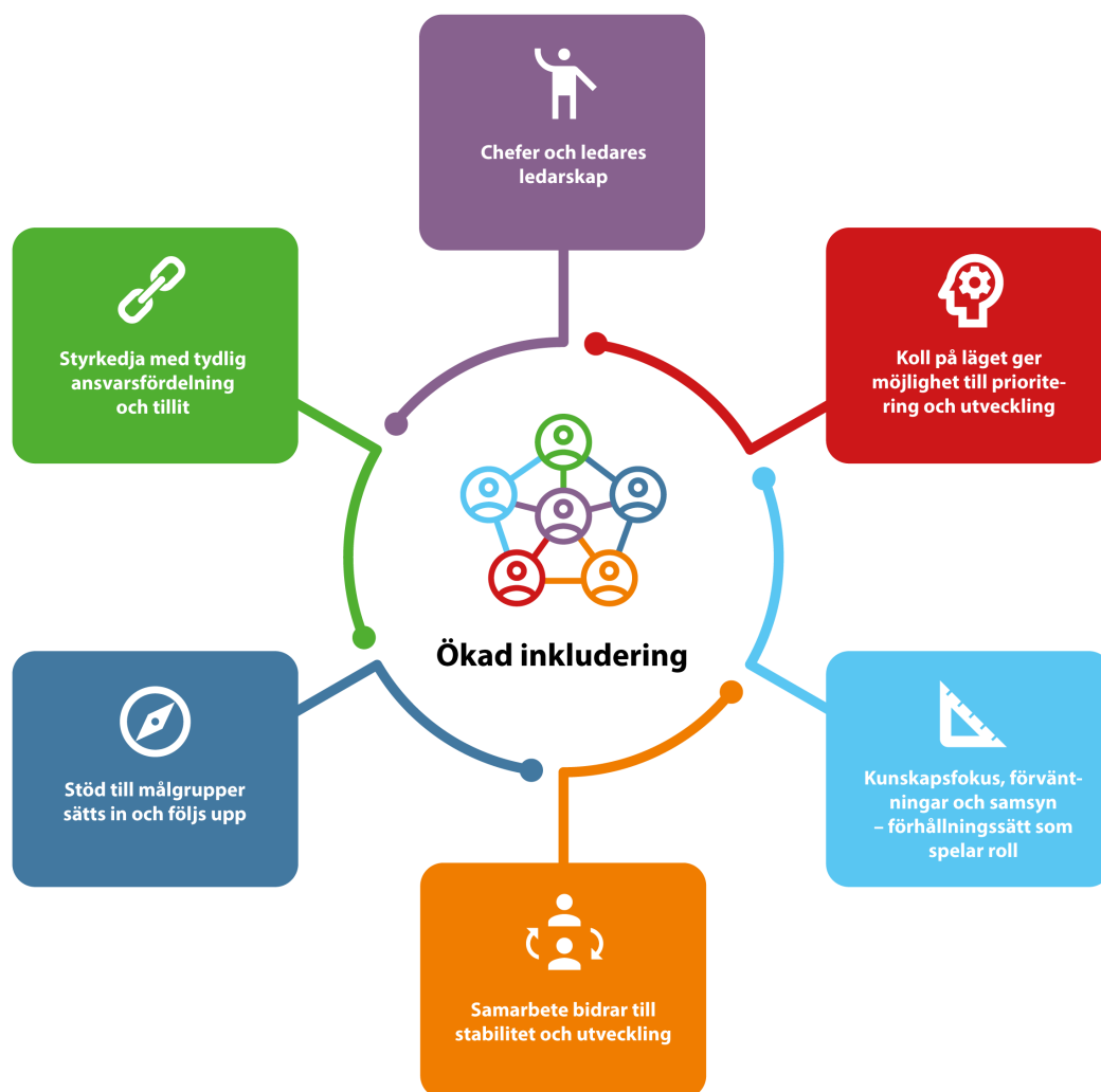
Bild 1. Komponenter för utvecklande inkluderingsarbete