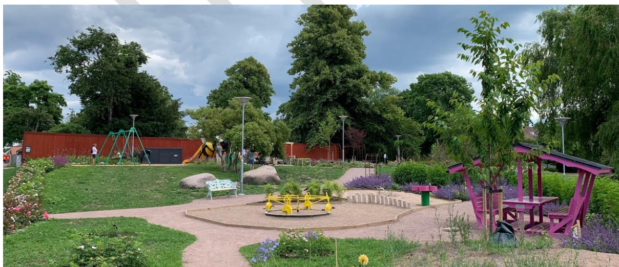
Kalmar Rosenträdgårds lekpark