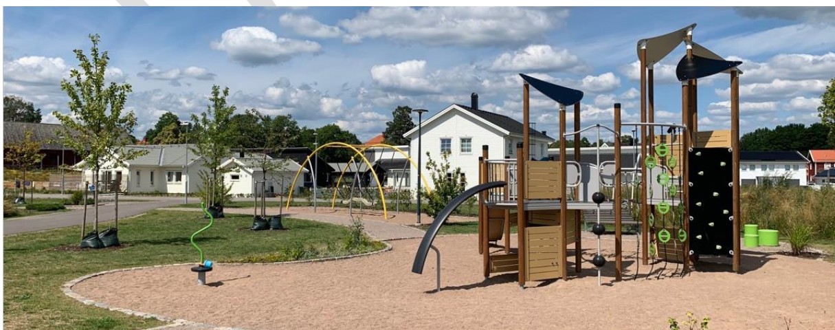
Kornlyckans lekpark, Ljungbyholm