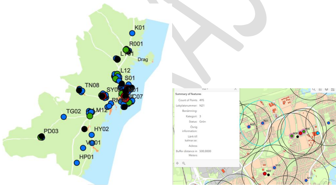
Lek – och aktivitetsmiljöer

I detta aktivitets- och lekplatsprogram avgränsas barn till att vara mellan 0-15 år.