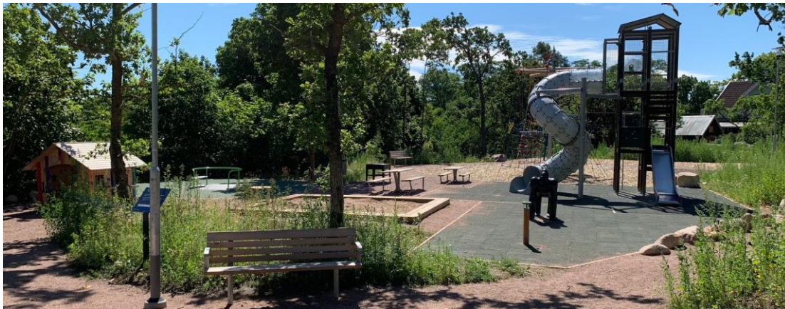
Stationsvägen, Rocknebys lekpark