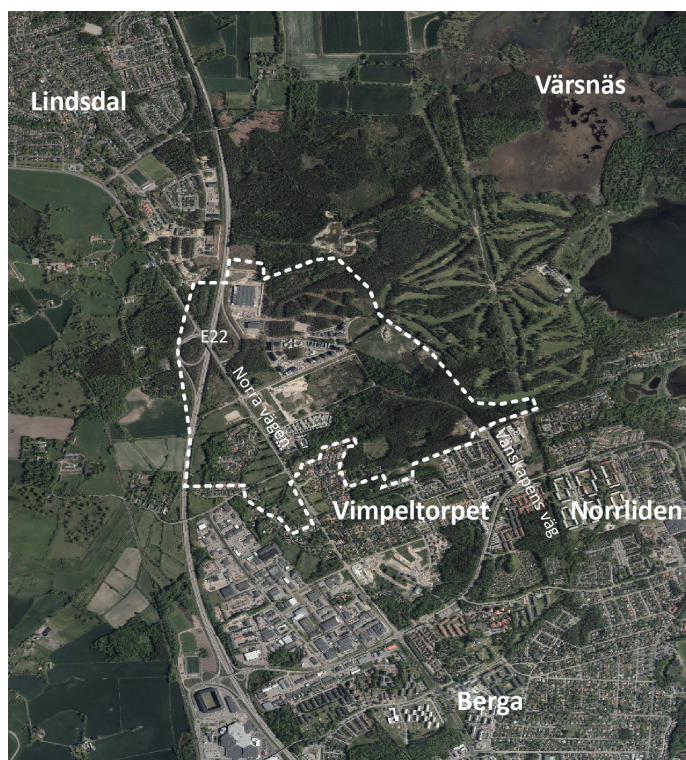
Avgränsning för programmet, se vit streckad linje