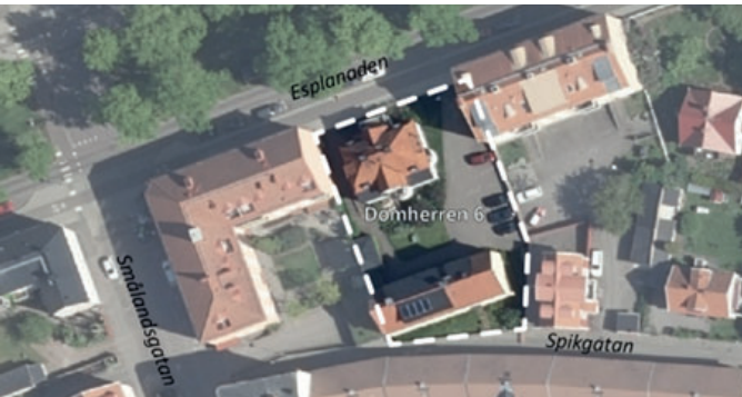
Det vitmarkerade området visar planområdets geografiska avgränsning.

Fastighetsägaren till då Domherren 6 (tidigare domherren 6) lämnade 2016-07-04 in en ansökan om planbesked för att komplettera bebyggelsen på fastigheten med ett nytt bostadshus mot befintlig brandgavel på Esplanaden 16A. I ett yttrande inför beslut i planutskottet 2016-10-03 föreslog Samhällsbyggnadskontoret att ge ett positivt svar till sökanden.