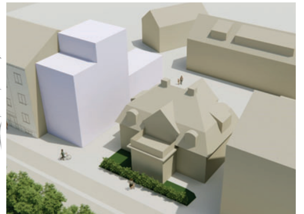
3d-vy från Esplanaden