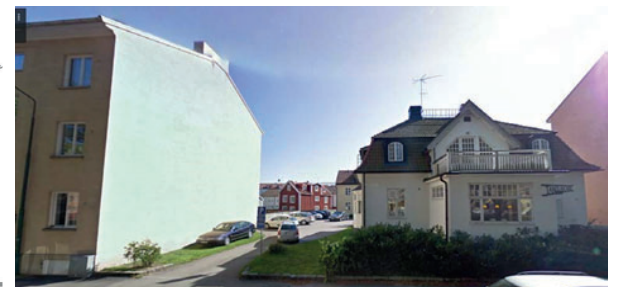
Gatuvy från Esplanaden