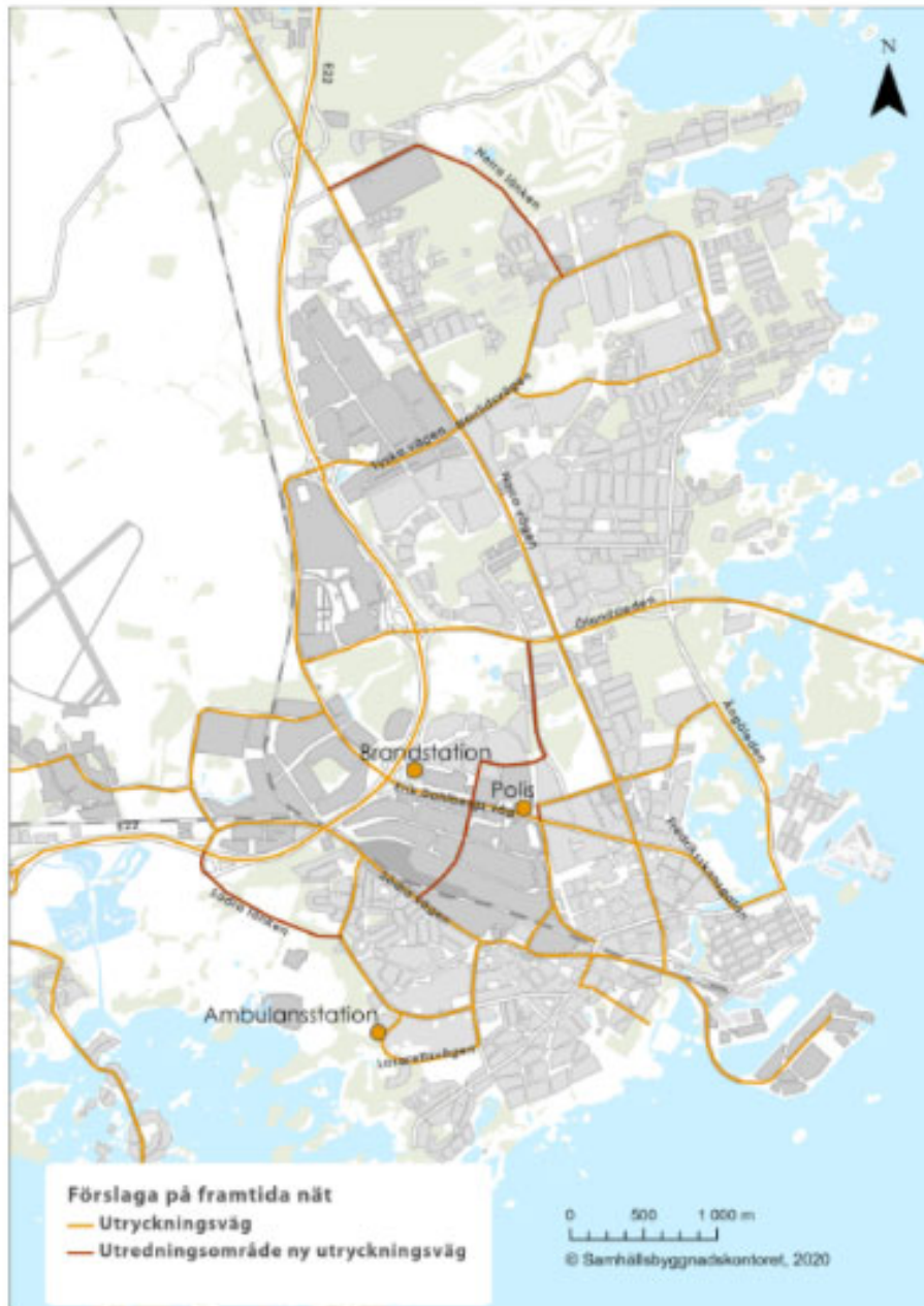
Förslag på framtida utryckningsväg