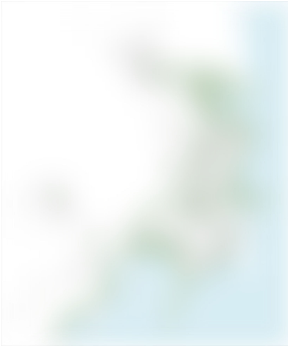
Viktiga gröna stråk i Kalmar stad