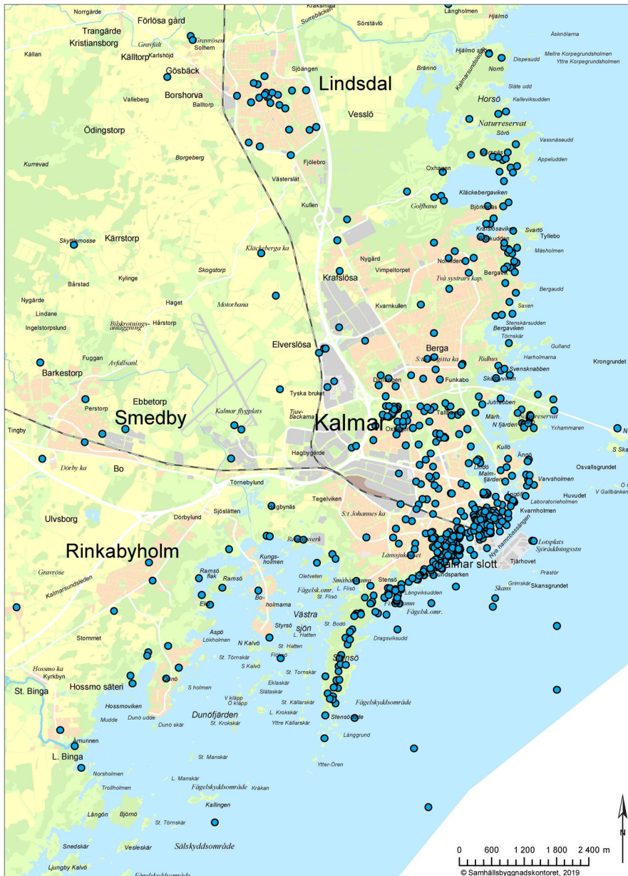
Invånarnas favoritplatser i kommunen, inzoomat på staden.