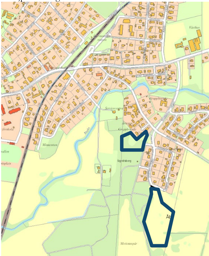
Läckeby, Snättebro etapp 2

Inom ungefär angivna områden, nedan markerade med blått, arbetar Kalmar kommun med framtagande av detaljplaner eller genomförande av detaljplaner för villatomter. En förutsättning för försäljning av villatomter i områdena är att detaljplan får laga kraft.