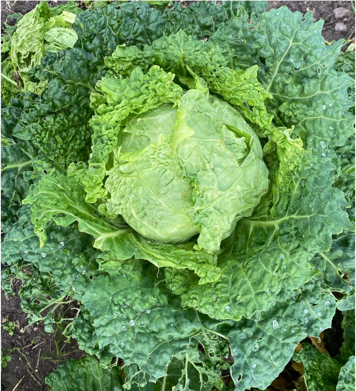
Kålkraft hösten 2021

från Miljöpartiet de gröna Kalmar kommun