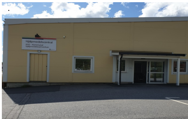
KHS hjälpmedelscentral Timmergatan 2B, Västervik