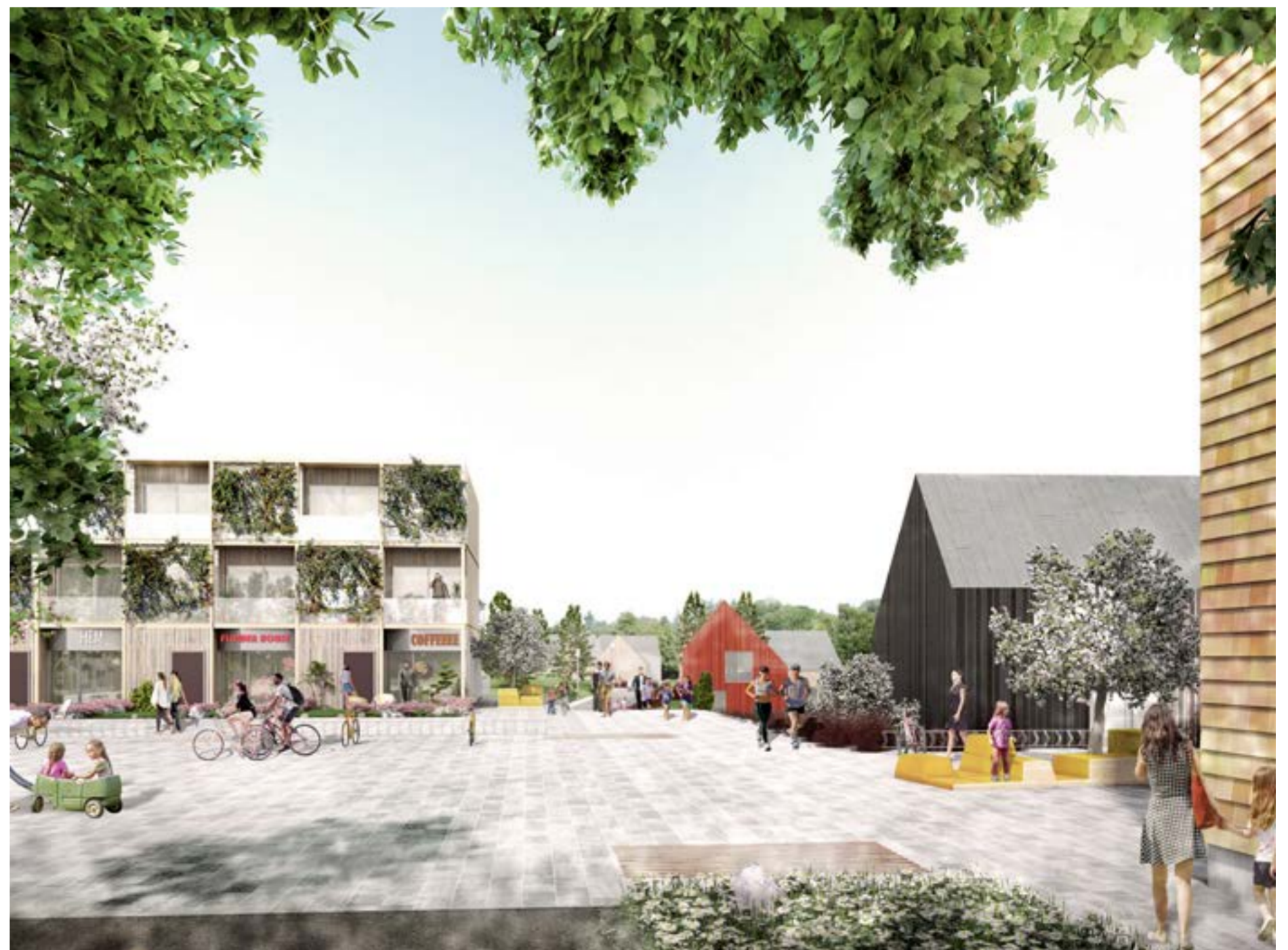
Illustrationen visar hur övergången från etapp 1 som är mer stadsmässigt och etapp 2 som är mer småskaligt mer övervägande småhus skulle kunna se ut. Torget blir en korsningspunkt för flera trafikslag där trafik ska ske på gåendes villkor. I bottenplan i de stadsmässiga radhusen finns möjlighet till småskaliga centrumverksamheter.