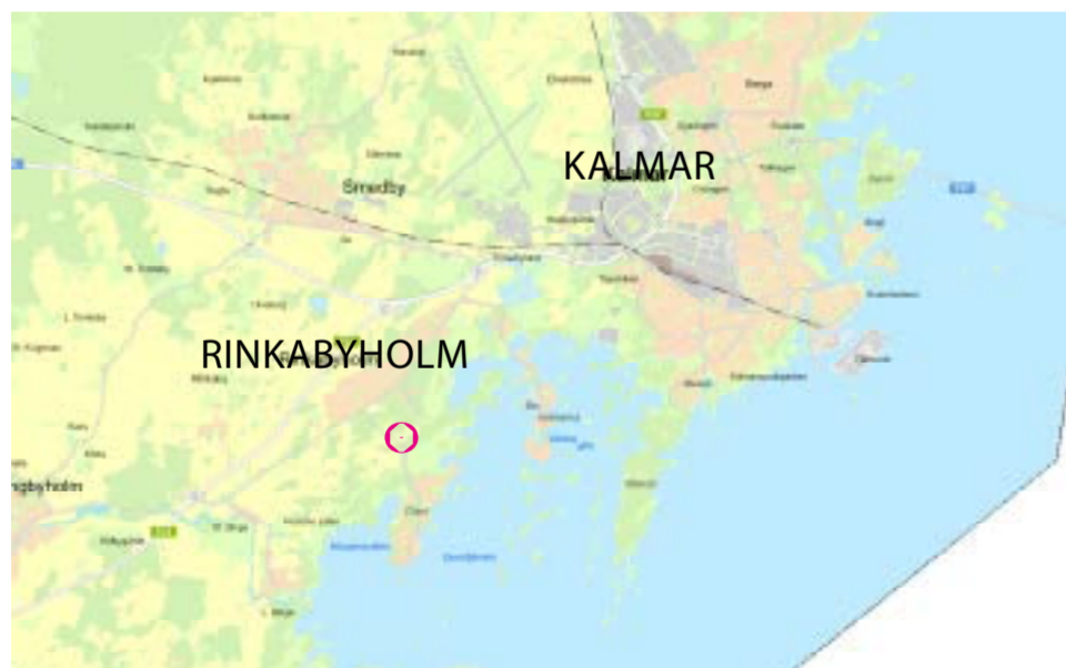
Det markerade området visar planområdets geografiska läge.