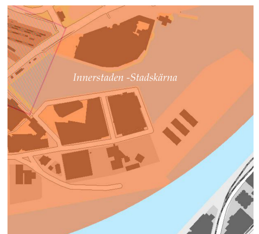
Utdrag ur gällande översiktsplan