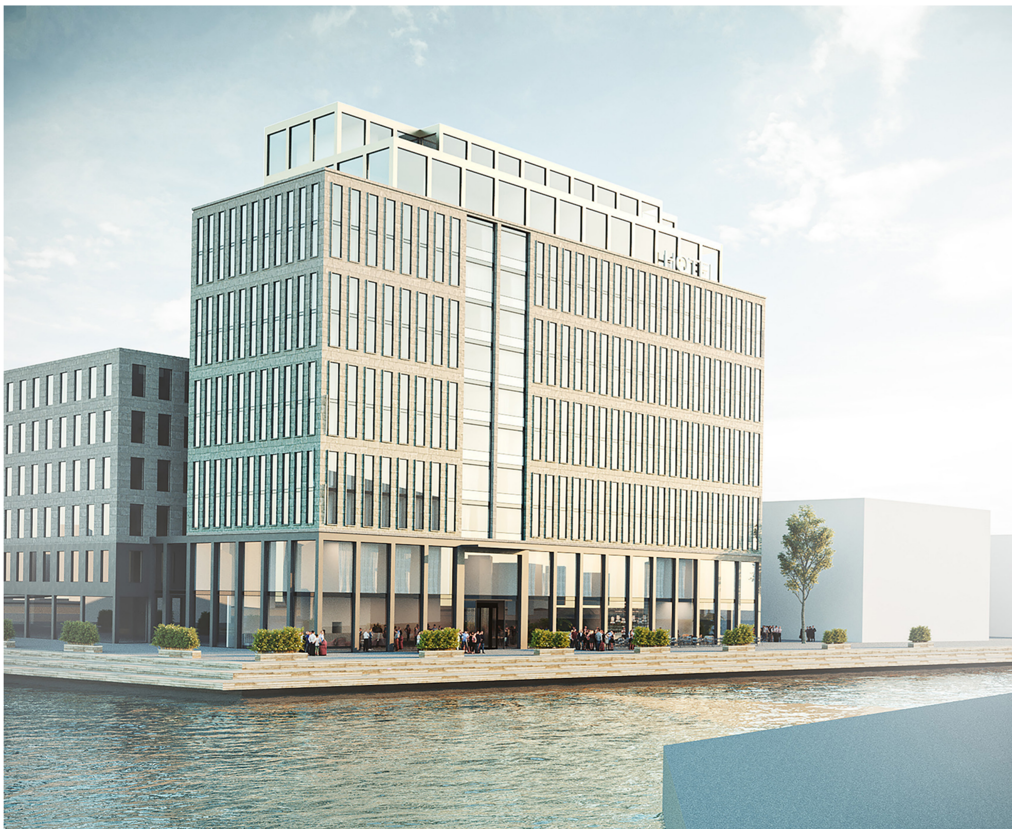
Illustration/3d-vy från nordväst (kajpromenaden baronen-sidan)